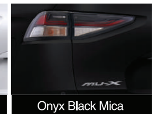
Onyx Black Mica